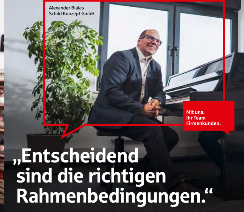
Alexander Bialas Schild Konzept GmbH

„Unser Erfolg ist die Menge an geteiltem Glück.“