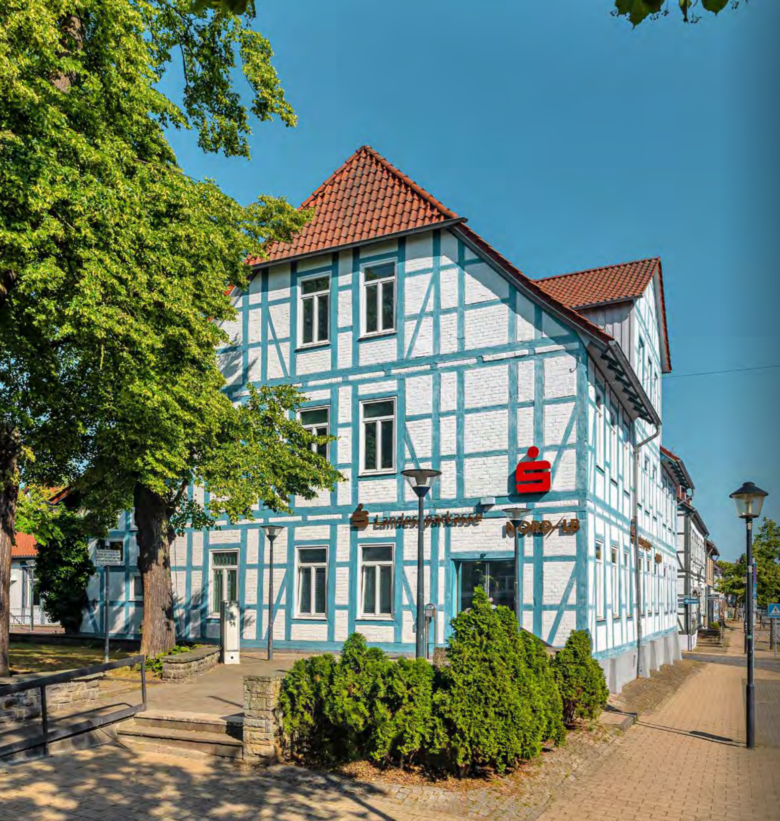
Unsere wunderschöne Filiale in Vorsfelde – einer von 88 Standorten im alten Braunschweiger Land.